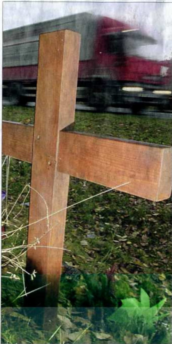
Wenn Eltern ein Kind verloren, dann verlieren sie auch den Boden unter den Füßen.